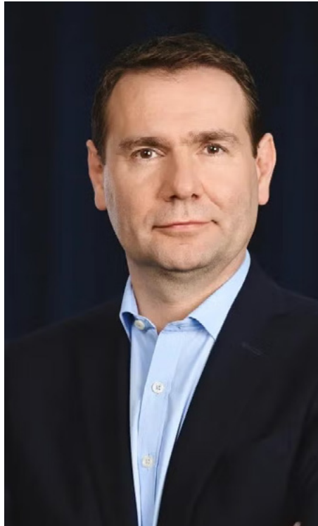
Alexandre Ricard, CEO, Pernod Ricard